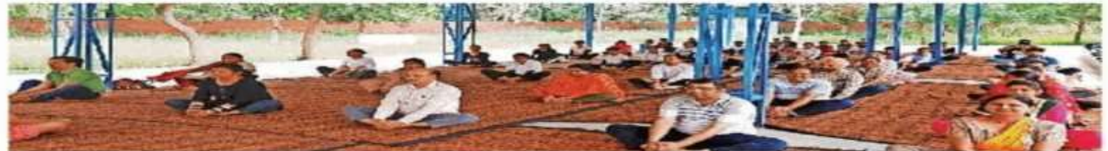
ਕਾਲਜ 'ਚ ਯੋਗ ਕਰਦੇ ਹੋਏ ਸਟਾਫ਼ ਅਤੇ ਵਿਦਿਆਰਥੀ।

ਇਸ ਮੌਕੇ ਉਪਰ ਪ੍ਰਿੰਸੀਪਲ ਨੇ ਸਟਾਫ਼ ਅਤੇ ਵਿਦਿਆਰਥੀਆਂ ਨਾਲ ਮਿਲ ਕੇ ਯੋਗ-ਆਸਣਾਂ ਵਿਚ ਬਰਾਬਰ ਭਾਗ ਲਿਆ ਅਤੇ