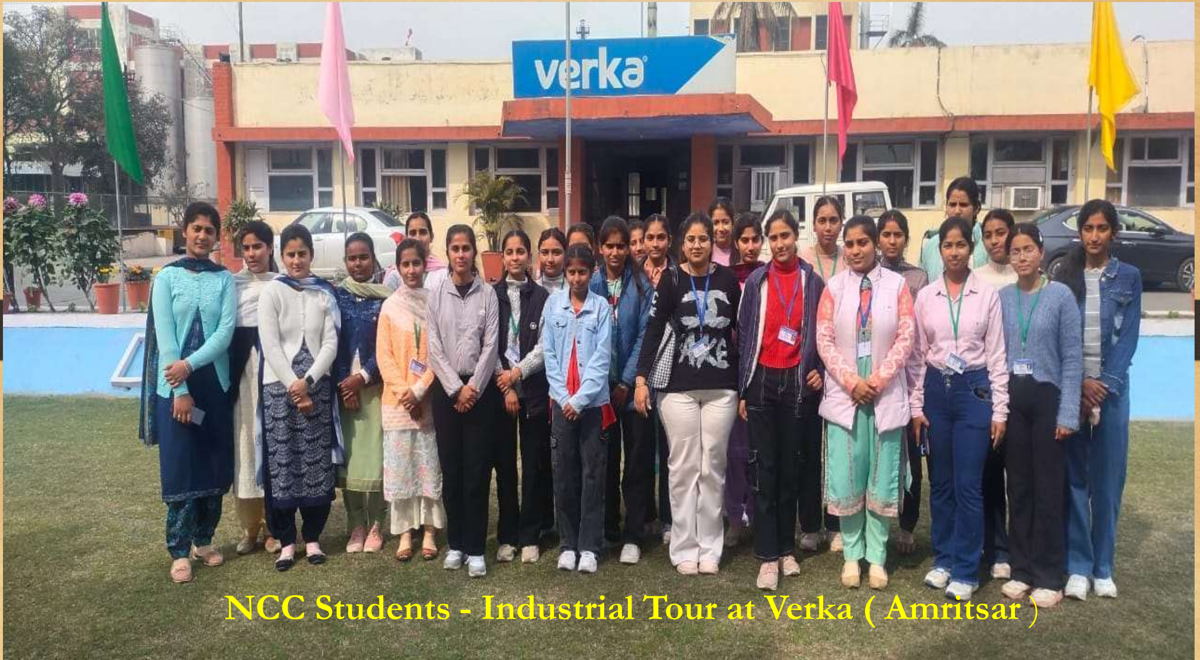
NCC Students - Industrial Tour at Verka ( Amritsar )