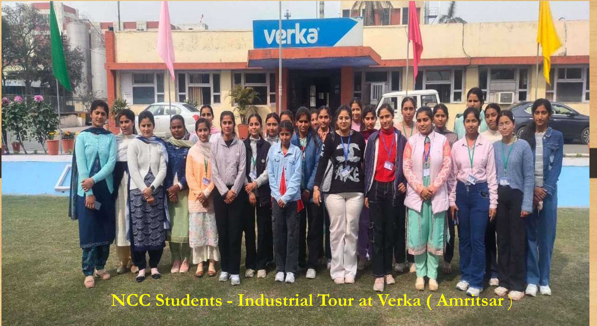
NCC Students - Industrial Tour at Verka ( Amritsar )